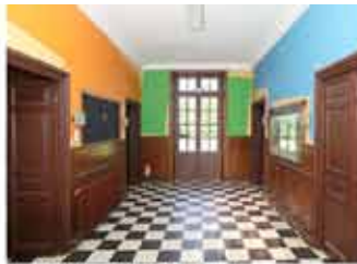
Hall d'entrée - Christophe Cuzin De Nîgers décalages, 2007