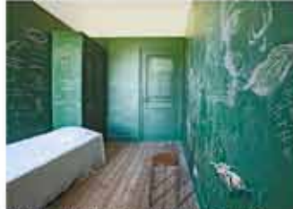
Chambre du 1er étage - Véronique Jourmard Jules Ferry, 2010