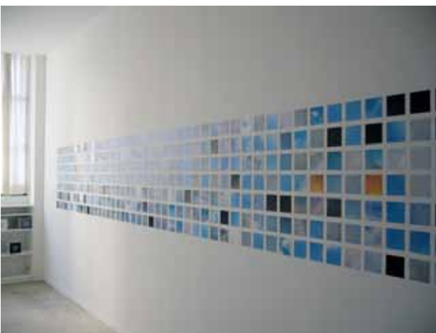
Une année de ciel , 2007 édition, tirage offset sur papier

Né en 1963 (Nice). Vit et travaille à Paris http://30000jours.free.fr/