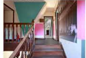
Hall du 2ème étage - Miquel Mont Collages muraux, 2010