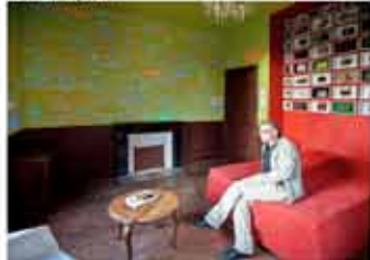
Chambre du 1er étage - Pierre Mabille (Peinture) Sans titre, 2011. & Sylvie Ruaux (photo-montage) 2008