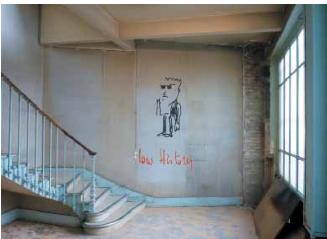
Low History , 2006 - 2010 agrandissement, peinture acrylique