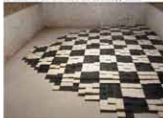
Cavén, Fabrice Parizy Échec et satiné, 2008