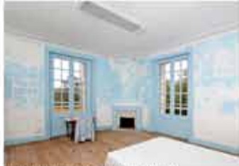
Chambre du 1er étage - Sylvie Ruaux Ciel de lit, 2012