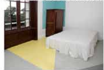
Chambre 1er étage - Bruno Rousselot SN°3, 2008