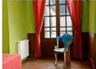
Chambre du 1er étage - Christophe Cuzin Rocaille, 2012