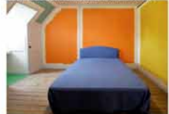
Chambre du 2ème étage, Christophe Cuzin Bierpeint/Malpeint, 2007