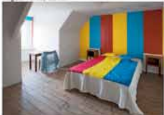
Chambre du 2ème étage, Patrice Ferrasse Papiers peints, 2007