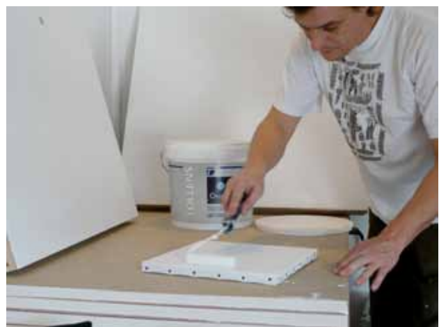
Inventaire des peintures blanches des lieux d'art contemporain , 2008 - 2012 Peintures sur châssis (30 x 30 cm) et photographies (30 x 40 cm)