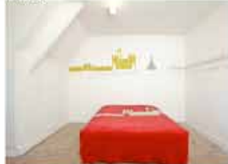
Chambre du 2ème étage, Heidi Wood La bataille du château de Loctudy, 2010