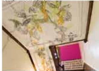
Plafond de l'escalier - Édouard Prulhière Peinture de château, 2011