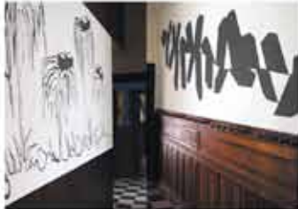
Couloir d'entrée - Carole Manranche Zone grise, etc., 2008