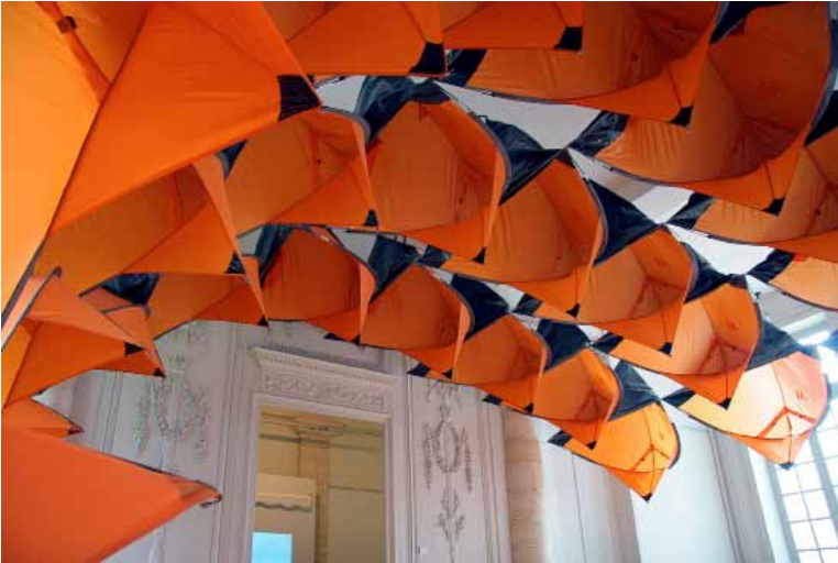
Abris de plage , 2006 Installation in situ Espace d'Art Contemporain, La rochelle

Né en 1980 (Cherbourg). Vit et travaille à Cherbourg http://jeanfrancoisfeuillant.wordpress.com/