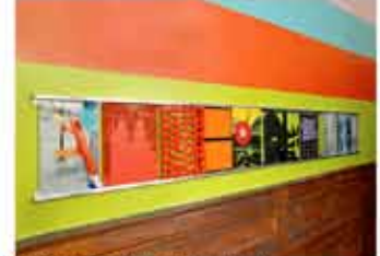
Couloir du 1er étage - Sylvie Ruaux Rail movie, 2011