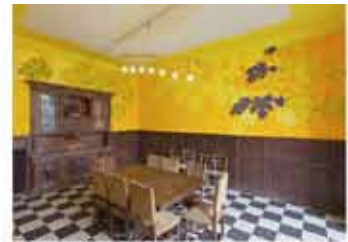
Salon à manger - Charles Belle - L'heure avant l'aube du jour suivant est toujours si cruellement noire- 2011