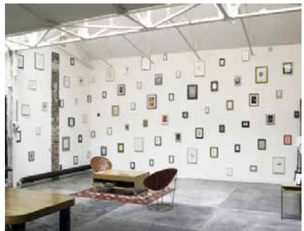
Vue de l'exposition A taste for red remains C.O.N.S.O.L.E., Paris, 2008