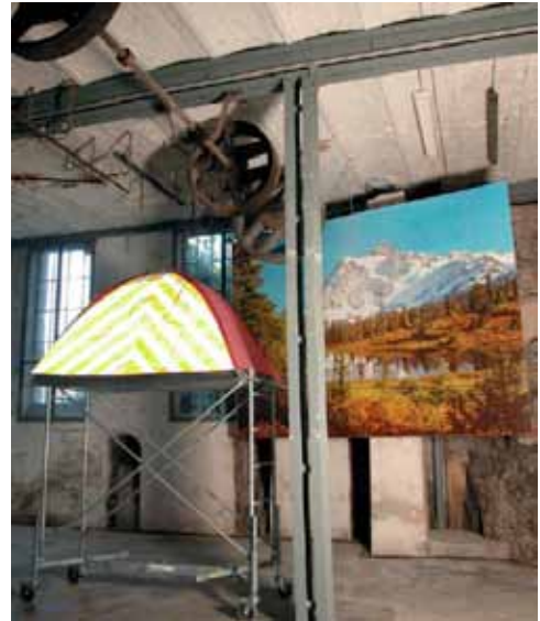
Illusion of Property , 2004 Le Creux de l'Enfer, Centre d'Art Contemporain, Thiers