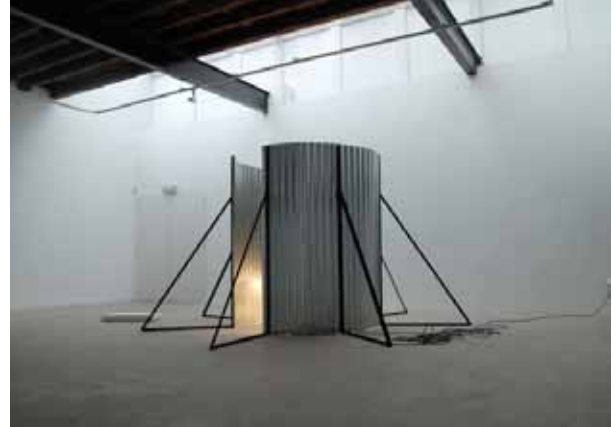
« between the building and the furniture », mai 2009, Londres, Angleterre 200 x 600 x 600 cm acier galvanisé, halogène