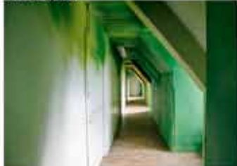
Couloir du 2ème étage, Flora Moscovici Vague verte, 2012