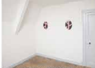
Chambre du 2ème étage, Sylvie Fanchon SF, 2008